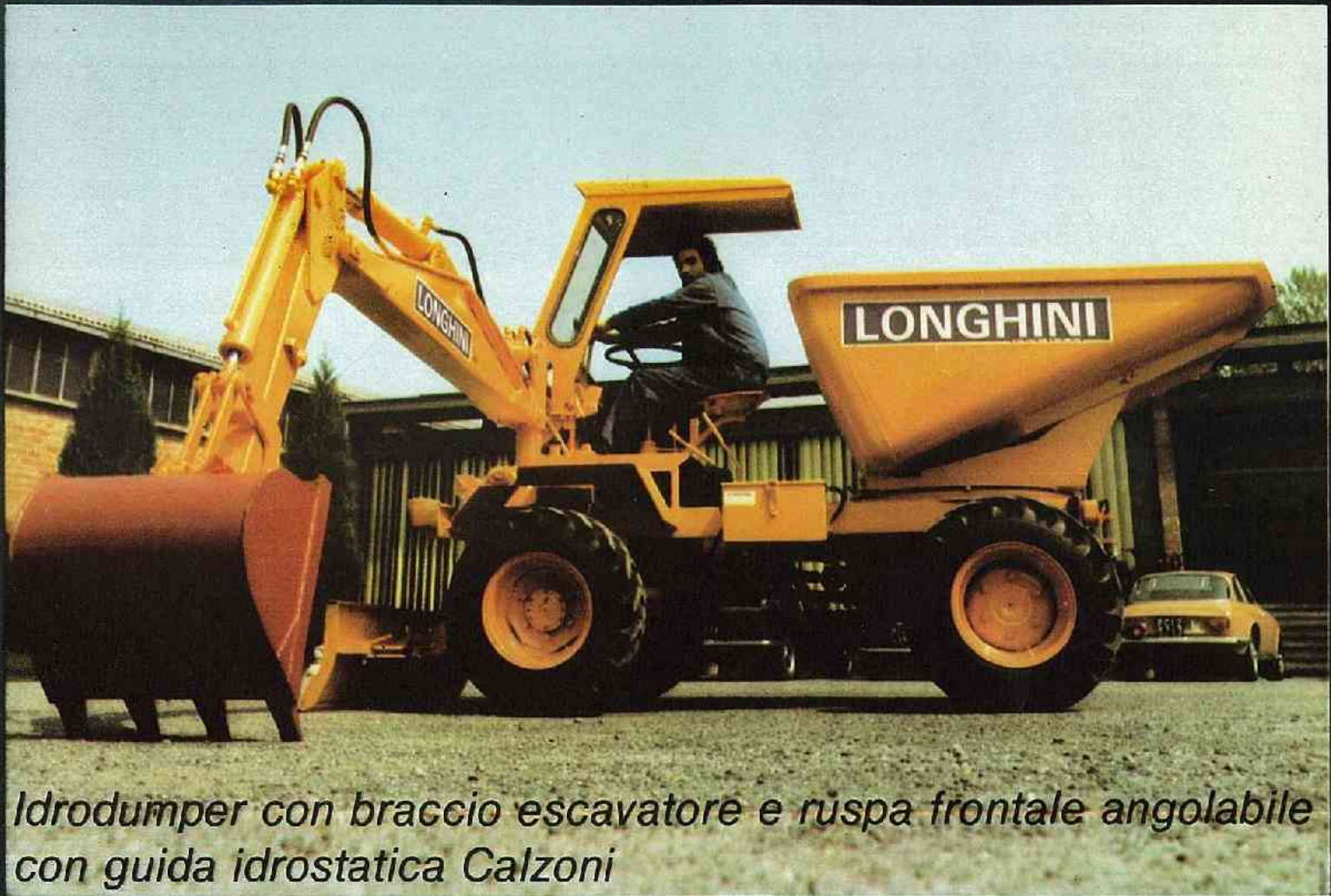
Idrodumper con braccio escavatore e ruspa frontale angolabile con guida idrostatica Calzoni

Omologato per la circolazione stradale - Completamente idraulico - massima resa economica - PRESTAZIONI: Polivalente per escavazione - riempimento - Spianamento - carico e trasporto